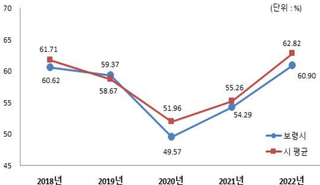
유형 지방자치단체와 재정자주도 비교